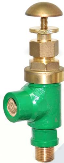
Fig. 250 Rosca M-H

Fig. 250: Rosca Macho-Hembra Fig. 251: Brida con suplemento, espárragos, tuercas y junta de neopreno.