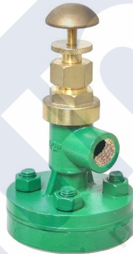
Fig. 251 Brida y suplemento